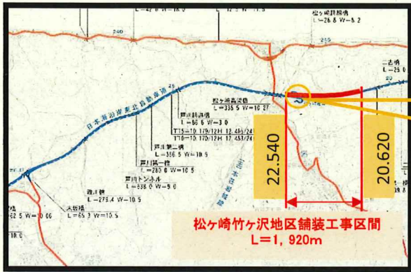
◎位置図(日東道(大内JCT～岩城IC) 松ヶ崎竹ヶ沢地区舗装工事区間)

工事期間中、上り線側の松ヶ崎亀田IC出口は利用出来ません。松ヶ崎及び亀田地域へ向かう方は、国道7号を迂回してください。